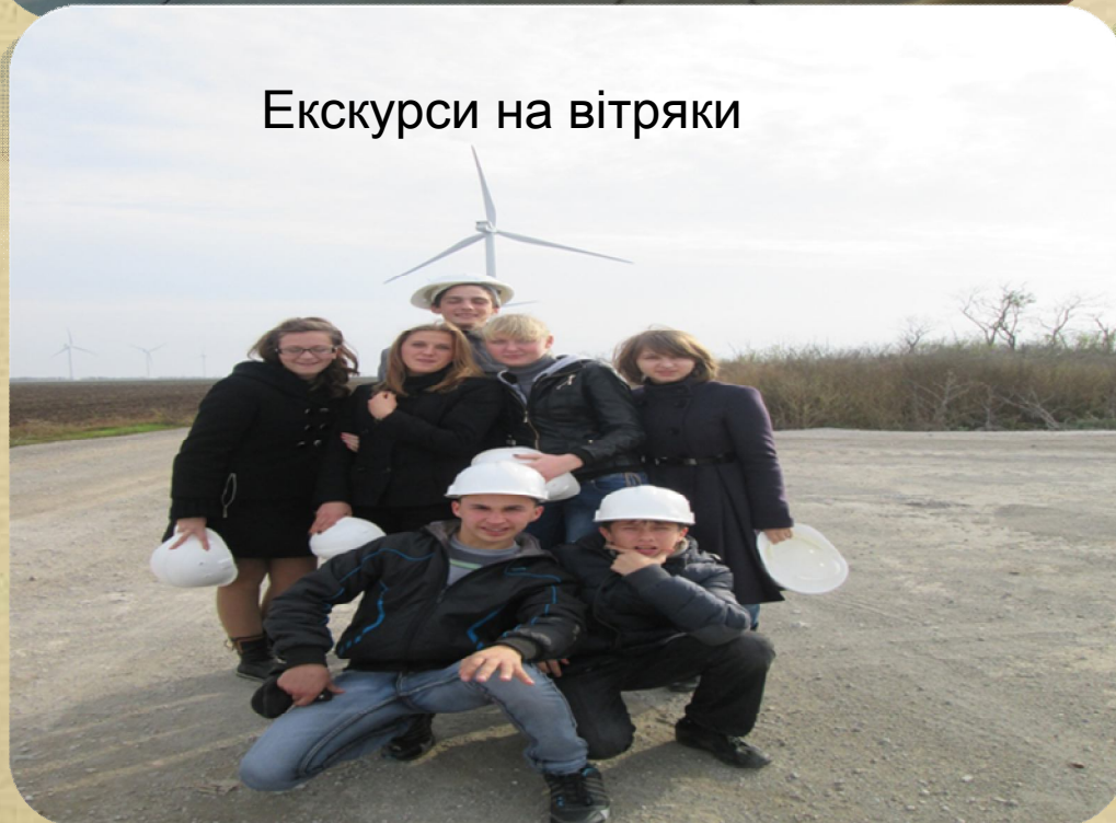
Екскурси на вітряки