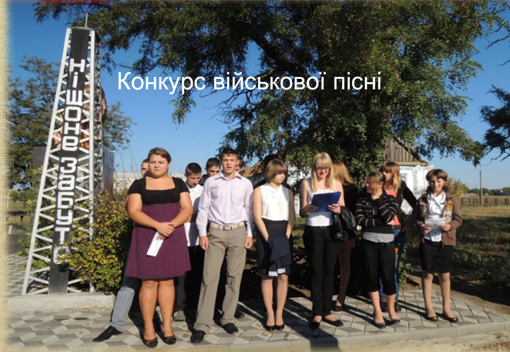
Конкурс військової пісні