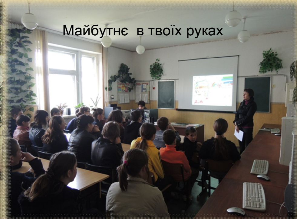
Майбутнє в твоїх руках