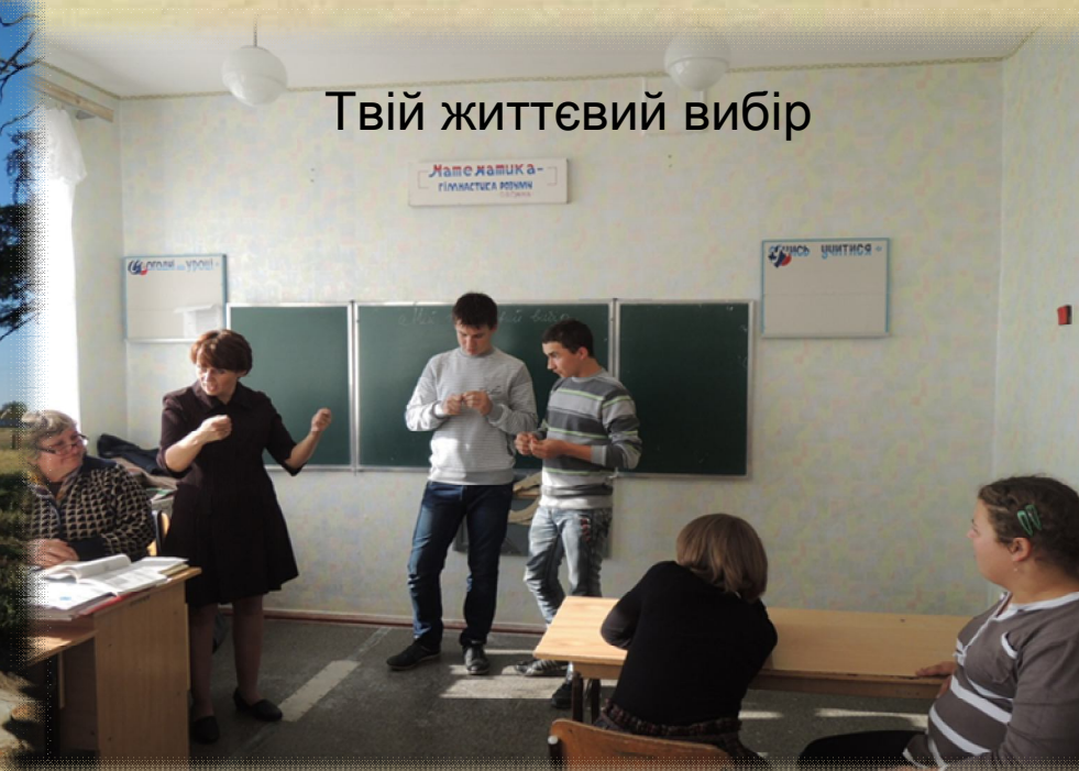
Твій життєвий вибір