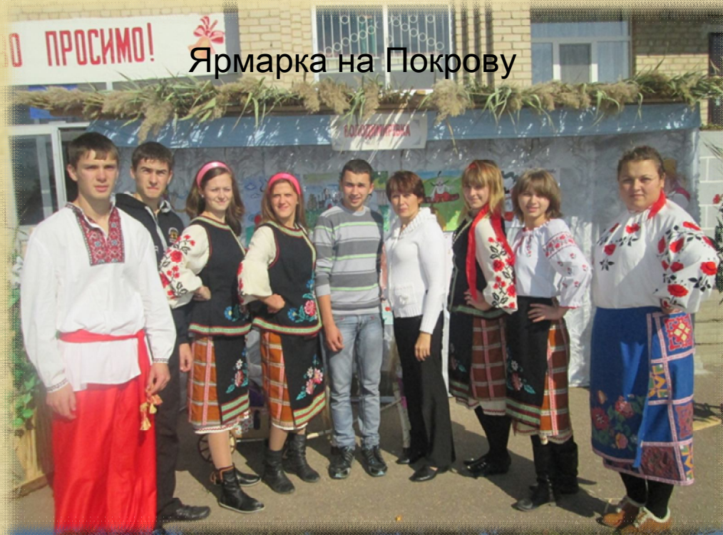
Ярмарка на Покрову